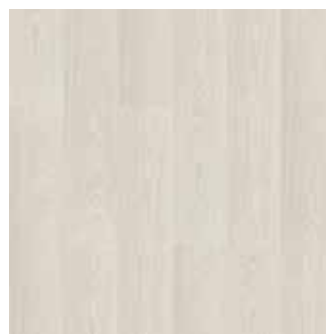
LOS ANGELES REF: 016007