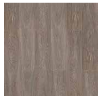
SHANGHAI REF: 016304