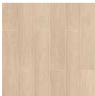
CHICAGO REF: 015994