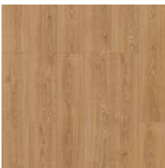
PEKING REF: 016175